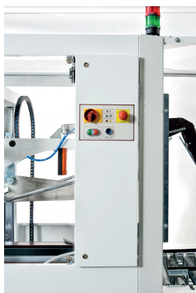
Sidovy CT 303 SDF